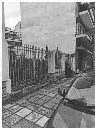
Άποψη περίφραξης Παλακουριαζή 48

Θέμα: ΕΚΘΕΣΗ ΑΥΤΟΨΙΑΣ ΕΠΙΚΙΝΔΥΝΩΝ ΚΙΓΚΛΙΔΩΜΑΤΩΝ ΠΕΡΙΦΡΑΞΗΣ (από άποψη στατική)