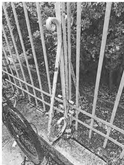
Στήριξη νέων κιγκλιδωμάτων